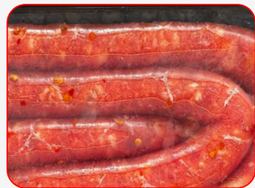
MAP / ATM