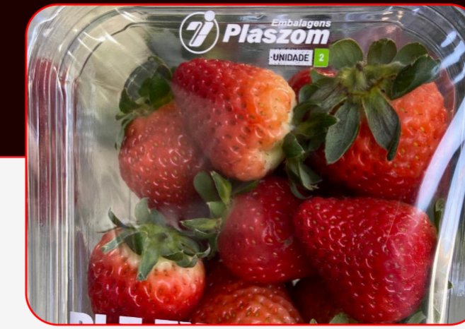
Sealing / Sellado