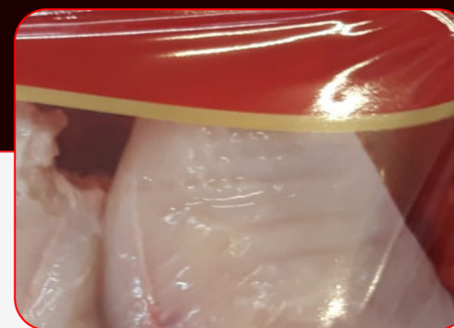
Sealing / Sellado

Semi-automatic sealer / Selladora semiautomática