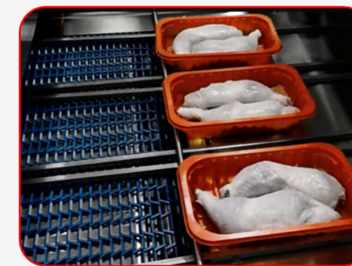
Sealing / Sellado