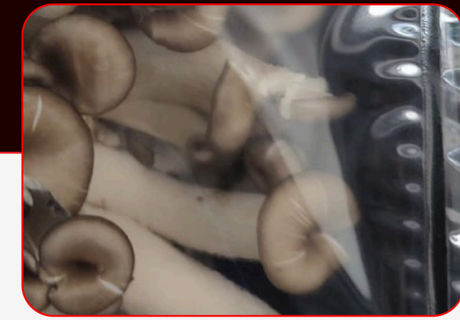
Sealing / Sellado