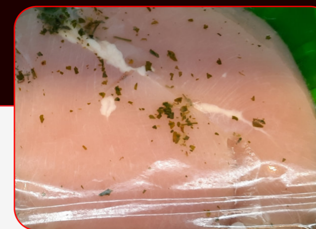
Sealing / Sellado