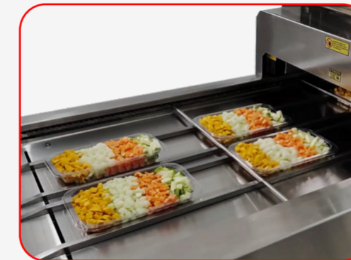
Sealing / Sellado