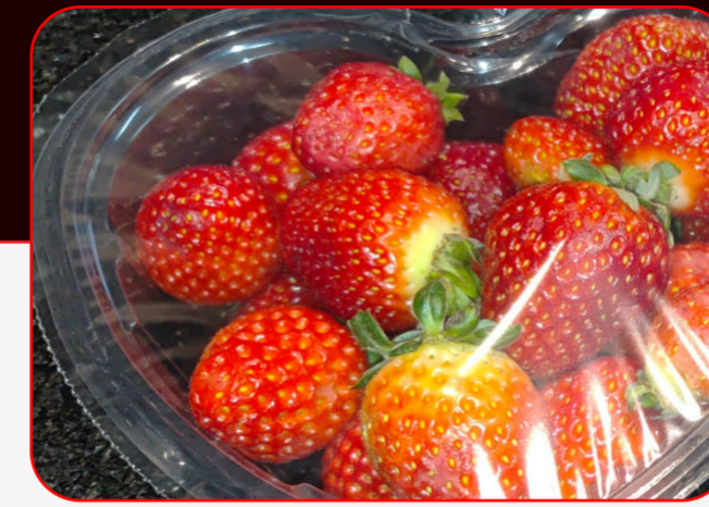
Sealing / Sellado

Semi-automatic sealer / Selladora semiautomática