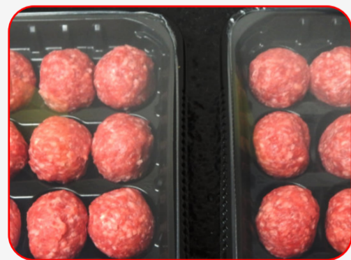
MAP / ATM