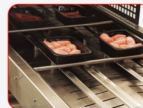
Sealing / Sellado