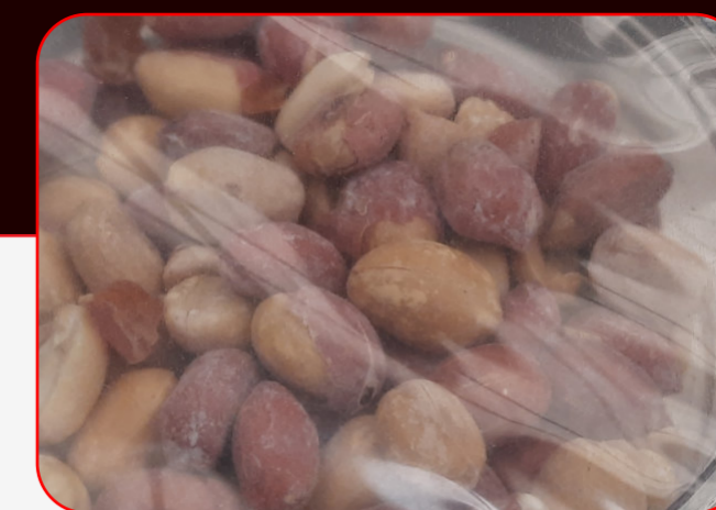
Sealing / Sellado